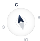
На схеме квартала